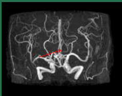
頭部MRA(頭部血管映像)

78歳、女性 めまいで来院。当院でMRI検査し、頭の血管に動脈瘤 (脳底動脈瘤) が見つかった。