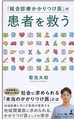
(幻冬舎 令和3年12月17日発売)